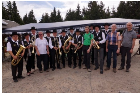
Der Berggasthof Auersberg wurde privatisiert und mit dem Ministerpräsidenten wieder eröffnet. Der Ortschaftsrat Wildenthal lehnte dies ab.