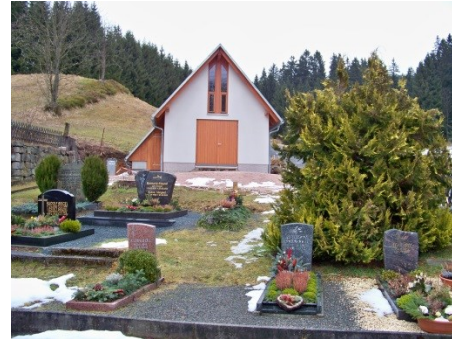
Bau einer neuen größeren Trauerhalle und eines neuen ansprechenden Zugangs in Verbindung mit dem Radweg dorthin