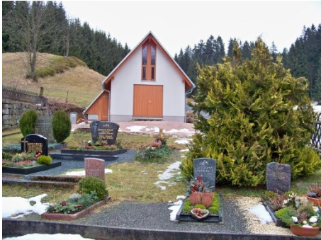
Bau einer neuen größeren Trauerhalle und eines neuen ansprechenden Zugangs in Verbindung mit dem Radweg dorthin