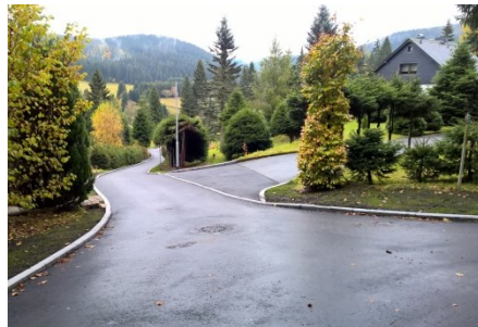
Die Straße zum Mühlberg wurde grundhaft neu gebaut.

Darüber hinaus haben wir viele kleinere Projekte finanziert. Dazu gehören: - die Sanierung der Postmeilensteine, - Erneuerung und Instandhaltung der touristischen Kleininfrastruktur (Sitzgruppe Dorfring u.a.) - die Sanierung der Bachmauern und des große Teile des Parkes Durch unsere sparsame und solide Haushaltsführung gelang es, in jedem Ortsteil große Projekte zu realisieren.