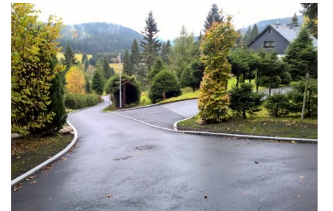
Die Straße zum Mühlberg wurde grundhaft neu gebaut.

Darüber hinaus haben wir viele kleinere Projekte finanziert. Dazu gehören: - die Sanierung der Postmeilensteine, - Erneuerung und Instandhaltung der touristischen Kleininfrastruktur (Sitzgruppe Dorfring u.a.) - die Sanierung der Bachmauern und des große Teile des Parkes Durch unsere sparsame und solide Haushaltsführung gelang es, in jedem Ortsteil große Projekte zu realisieren.